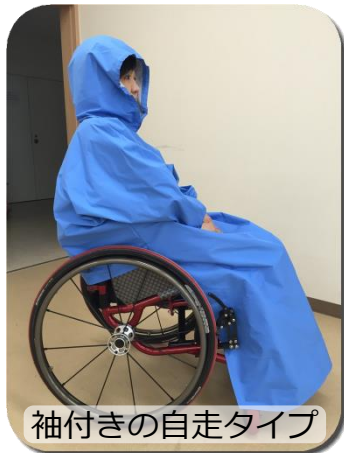
袖付きの自走タイプ

大きさ・袖の有無・分割・背面の処理・色・生地等、できるだけ使う方の要望に応じて製作します。色は青の他、赤や黄色などもあります。