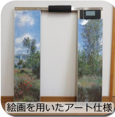
絵画を用いたアート仕様

「高い」「重い」「かさばる」というイメージを、「安い」「軽い」「ばらせる」と一新したタイプの車いす用体重計です。