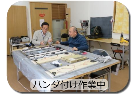
ハンダ付け作業中