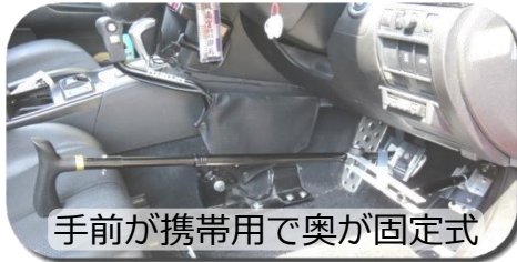
手前が携帯用で奥が固定式

代車やレンタカーなどの車で短期間使用する場合は、取り付け・取り外しが簡単にできる携帯用手動運転装置です。介護用の杖など市