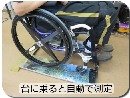
台に乗ると自動で測定