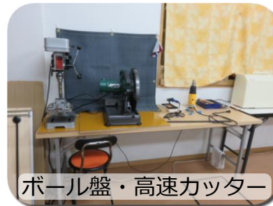
ボール盤・高速カッター

NPO法人なごみの1階を工房としてお借りしています。約25m 2 ほどのスペースに様々な工具や作業台があります。トイレや駐車場（要予約）もあります。